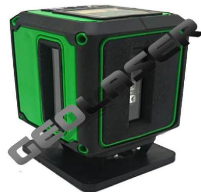
RC - 2V360

Incluye plataforma de apoyo que facilita el trabajo de alineación horizontal del instrumento.